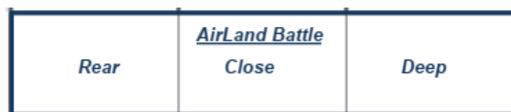
Σχήμα 1: Η διαμόρφωση του βάθους στο πλαίσιο του δόγματος «Μάχης του Εναέριου – Χερσαίου Χώρου» (Air – Land Battle).

Είναι εμφανές ότι ο καθοριστικός παράγοντας για την επίτευξη συγχρονισμού και συγκέντρωσης σε όλο το επιχειρησιακό βάθος, είναι η ενορχήστρωση όλων των ενεργειών. 37 Ο Στρατηγός Don Starry ανέλυσε με σαφήνεια την αλληλουχία και το συγχρονισμό των αμυντικών επιχειρήσεων των δυνάμεων του NATO για την αναχαίτιση των επιτιθεμένων δυνάμεων του Συμφώνου της Βαρσοβίας στο ευρωπαϊκό θέατρο, καταδεικνύοντας έτσι τη σπουδαιότητα του συγχρονισμού και της συγκέντρωσης της μαχητικής ισχύος. 38 Παρομοίως, κατά τη διάρκεια της επιχειρήσεως «Desert Storm», η ορθή εφαρμογή των παραπάνω αρχών στο πλαίσιο της έννοιας της Μάχης του Εναέριου – Χερσαίου Χώρου (Air – Land Battle) επέτρεψε την ταχεία ήττα των ιρακινών δυνάμεων και την απελευθέρωση του Κουβέιτ. Για την πλήρη και ορθή εφαρμογή της συγκεκριμένης έννοιας, η αρχή του βάθους διαμορφώθηκε κατά τρόπο ώστε να υποβοηθά τον ευχερή συγχρονισμό των φιλίων ενεργειών. Η μορφή που έλαβε φαίνεται στο Σχήμα 1.